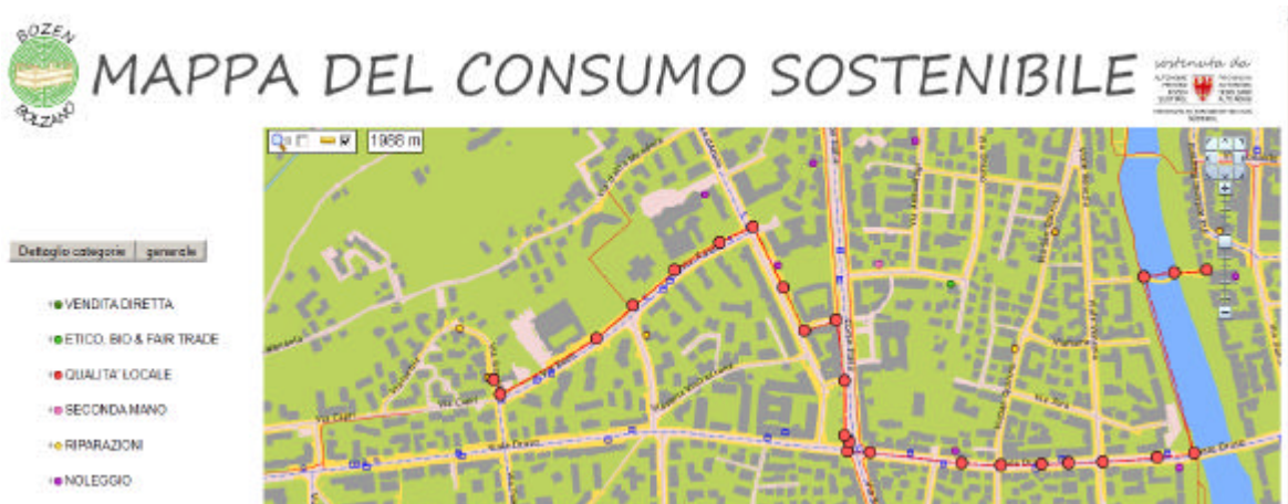
Fig. 6: Uso dello strumento “distanza” per misurare distanze da percorrere in bicicletta

Nella figura 6 viene mostrata la distanza (1988 m) che separa la biblioteca del Museion da Comfort bike (negoziò di riparazioni bici). Il percorso è stato scelto riferendosi quanto più possibile le piste ciclabili, tranne nel tratto di strada lungo viale Druso.