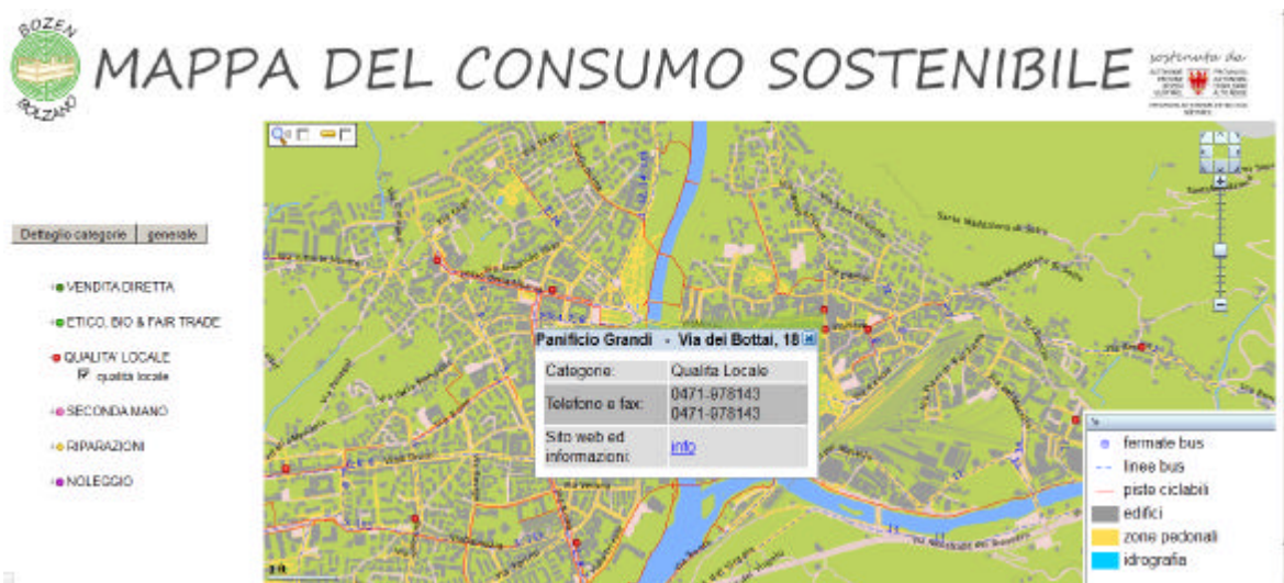
Fig. 3: Dettaglio prodotti “qualità locale”

Al centro dell’immagine viene mostrato ciò che succede se si clicca su un negozio, cioè su un punto della mappa. Si apre un riquadro che illustra i dettagli del negozio selezionato: nome, indirizzo, categoria, numero di telefono e fax e, molto importante, il sito web e le informazioni. Cliccando su info è possibile avere delle notizie ulteriori riguardo al negozio selezionato. Queste notizie verranno mostrate in un’altra finestra (vedi figura 4).