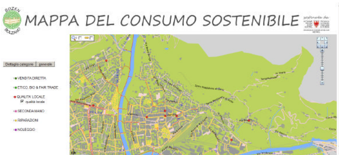
Fig. 2: Gruppo dei prodotti “qualità locale”

La Figura 2 mostra che selezionando solo una subcategoria (esempio “qualità locale”) appariranno sulla mappa solo i negozi contenuti in quella subcategoria.