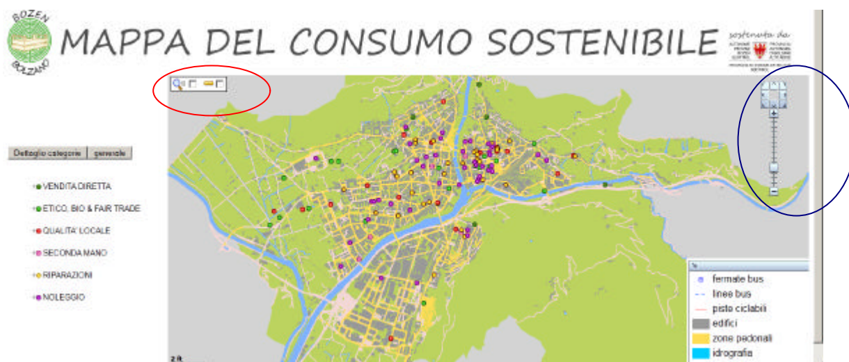
Fig. 1: Vista iniziale della mappa

I negozi contenuti nella mappa del consumo sostenibile sono suddivisi in sei categorie (vedi a sinistra). Cliccando il tasto “Dettaglio categorie” appaiono le subcategorie, mentre se si vuole tornare alla suddivisione generale dei negozi basta cliccare “generale”. In basso a destra invece si può osservare la legenda che mostra i contenuti della mappa base di Bolzano (piste ciclabili, edifici, idrografia, zone pedonali, fermate autobus e linee autobus). Alcune di queste informazioni vengono mostrate solo quando si zooma all'interno della mappa. Nel cerchio rosso si possono utilizzare due strumenti aggiuntivi: