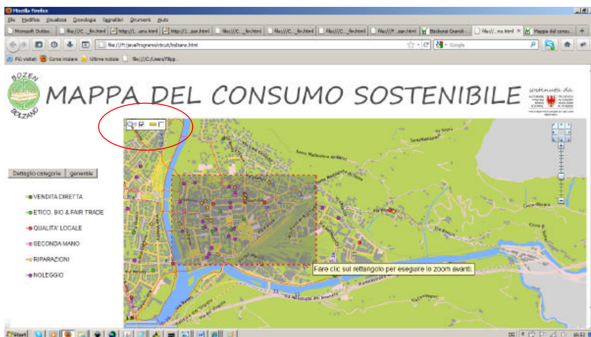
Fig. 7: Uso dello strumento “zoom”

Nella figura 6 viene mostrata la distanza (1988 m) che separa la biblioteca del Museion da Comfort bike (negoziò di riparazioni bici). Il percorso è stato scelto riferendosi quanto più possibile le piste ciclabili, tranne nel tratto di strada lungo viale Druso.