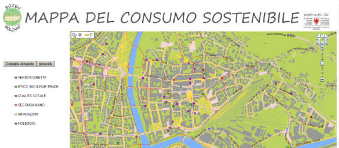
Fig. 8: Ingrandimento

Risultato dell'ingrandimento effettuato in figura 7: