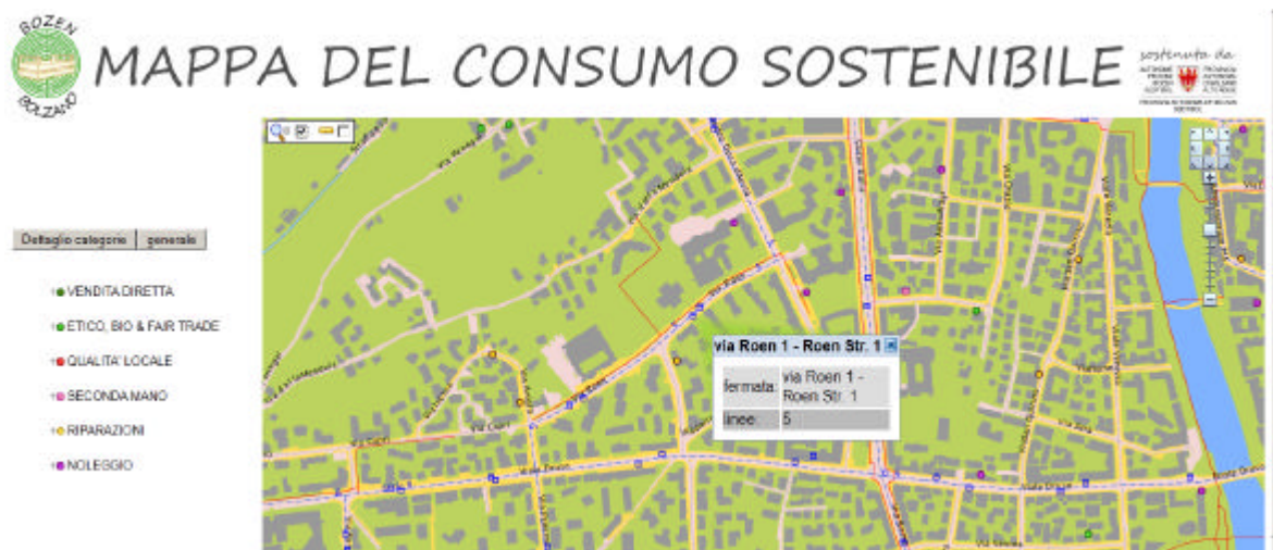
Fig. 9: Dettaglio informazioni fermate autobus

Nella figura sono mostrate le informazioni che un utente può ottenere cliccando sui singoli punti corrispondenti alle fermate dell'autobus: