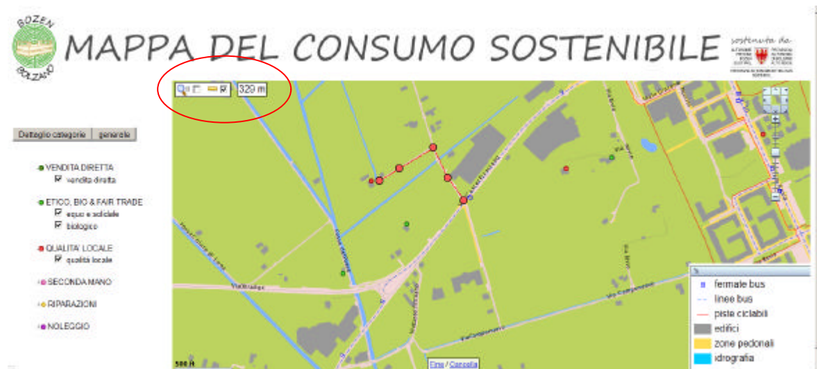
Fig. 5: uso dello strumento “distanza”

In alto a sinistra nel cerchio rosso è evidenziato lo strumento misuratore. Per essere utilizzato l’utente non deve fare altro che cliccare nella finestrella accanto all’icona e poi disegnare sulla mappa del consumo sostenibile la distanza che vuole misurare. Lo strumento è molto utile nel caso in cui si voglia misurare la distanza che separa il negozio a cui si è interessati dalla fermata dell’autobus più vicina e nel caso in cui si voglia vedere quale sia la distanza di un negozio da un altro punto della città da percorrere ad esempio utilizzando la bicicletta (figura 5).